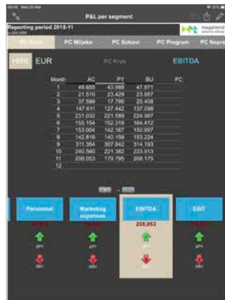
Izračun dobiti i gubitka prema pojedinim profitnim centrima, uz usporedbu s planskim vrijednostima za ovu godinu i rezultatima iz prošle godine za isto obračunsko razdoblje

Jednostavno, crtanjem prstom po ekranu možete istaknuti određene informacije u izvještajima te ih e-mailom poslati suradnicima na daljnju obradu, ili ih koristiti prilikom obrazloženja poslovnih odluka.