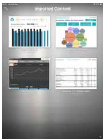
Pregled Dashboard2GO predložaka

Korisnik pristupa IBM-ovom Cognos Analytics serveru iz mobilne aplikacije korištenjem svog postojećeg korisničkog imena i lozinke. Samo korištenje mobilne aplikacije je intuitivno, a izgled izvještaja može biti usklađen s izgledom na standardnim uredskim računalima. Sinkroniziranje poslovnih izvještaja s podacima na serveru moguće je prema unaprijed definiranom rasporedu, ili prema zahtjevu korisnika.