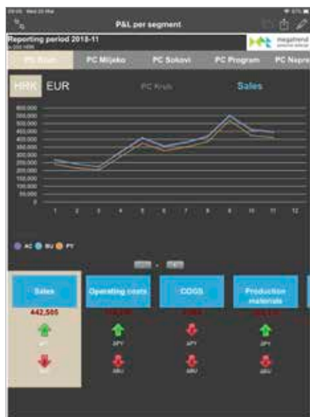
Izračun dobiti i gubitka prema pojedinim profitnim centrima, uz usporedbu s planskim vrijednostima za ovu godinu i rezultatima iz prošle godine za isto obračunsko razdoblje