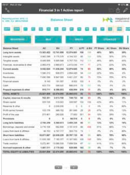
Bilanca s mogućnošću prikaza rezultata na razini tvrtke ili prema segmentima poslovanja, uz usporedbu s planskim vrijednostima za ovu godinu i rezultatima iz prošle godine za isto obračunsko razdoblje