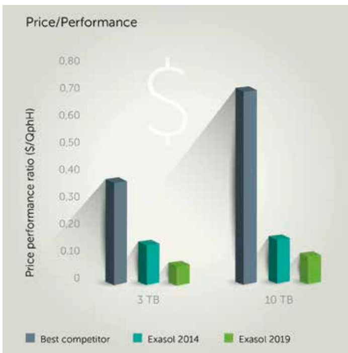
Rezultat TPC-H testa do 3000GB

u sustav. Sljedeći vrlo bitan faktor kojim se ostvaruje ubrzanje rada je tzv. pohrana i sažimanje podataka u stupcima (engl. Column-based storage and compression) kojom