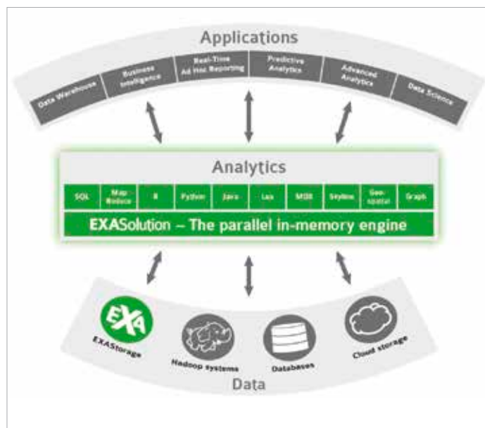
Struktura Exasol baze podataka

Uz to, imaju i lako skalabilnu arhitekturu koja se može proširiti ili smanjiti, bez potrebe za prekidanjem rada produkcijskih baza